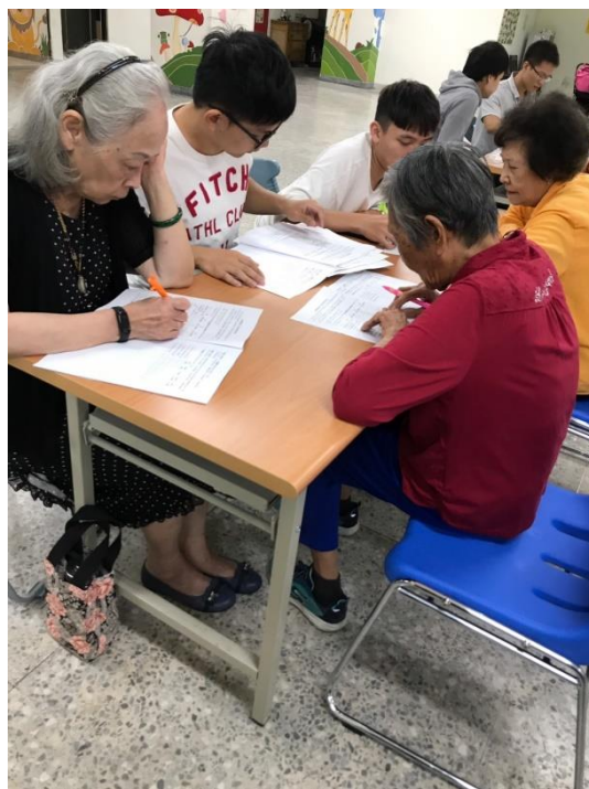
圖 2：高醫學生志工協助問卷填寫。

演講過後，便是高雄醫學大學的學生志工陪伴、關懷長輩，並協助問卷的填寫，氣氛亦是相當溫馨。