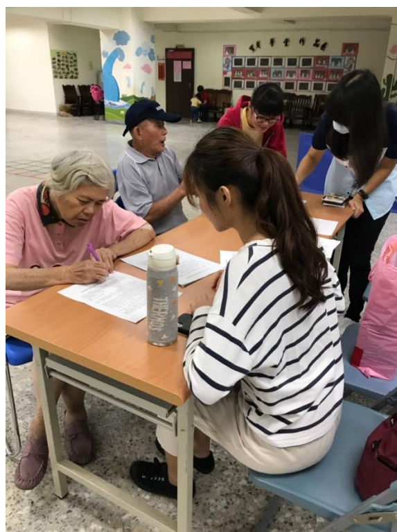
圖 3：高醫學生志工協助問卷填寫。