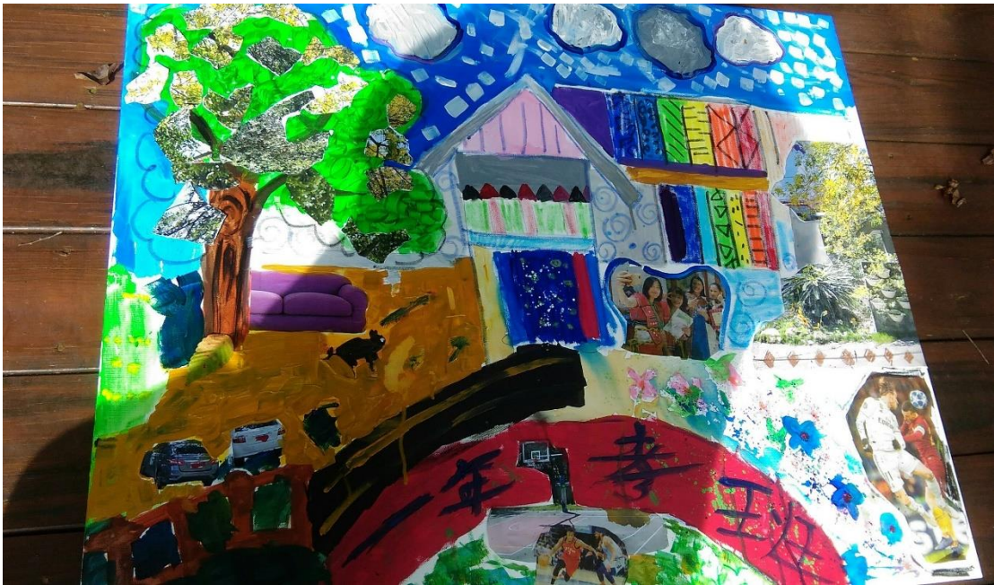
圖 4：桃源國中小朋友與志工齊心協力的繪畫成果之一。