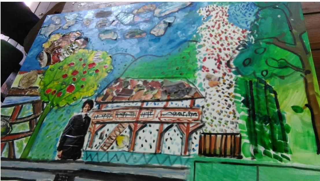
圖 5：桃源國中小朋友與志工齊心協力的繪畫成果之一。