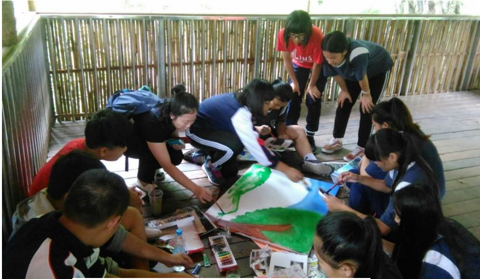
圖 2：桃源國中小朋友、志工繪畫過程。