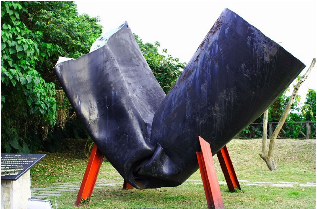
自來水博物館展示原埋設於台中縣豐原給水廠之地下輸水幹管，當時整支鋼管遭受強大拉力導致變形。