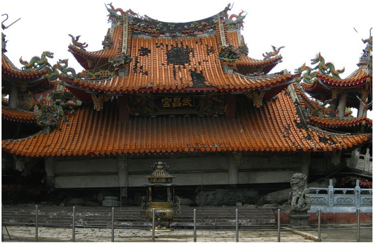
集集鎮正好在震央區，台鐵集集線的鐵軌嚴重扭曲，車站木造站房嚴重傾斜，居民信仰中心武昌宮的樑歪柱倒整座倒塌。