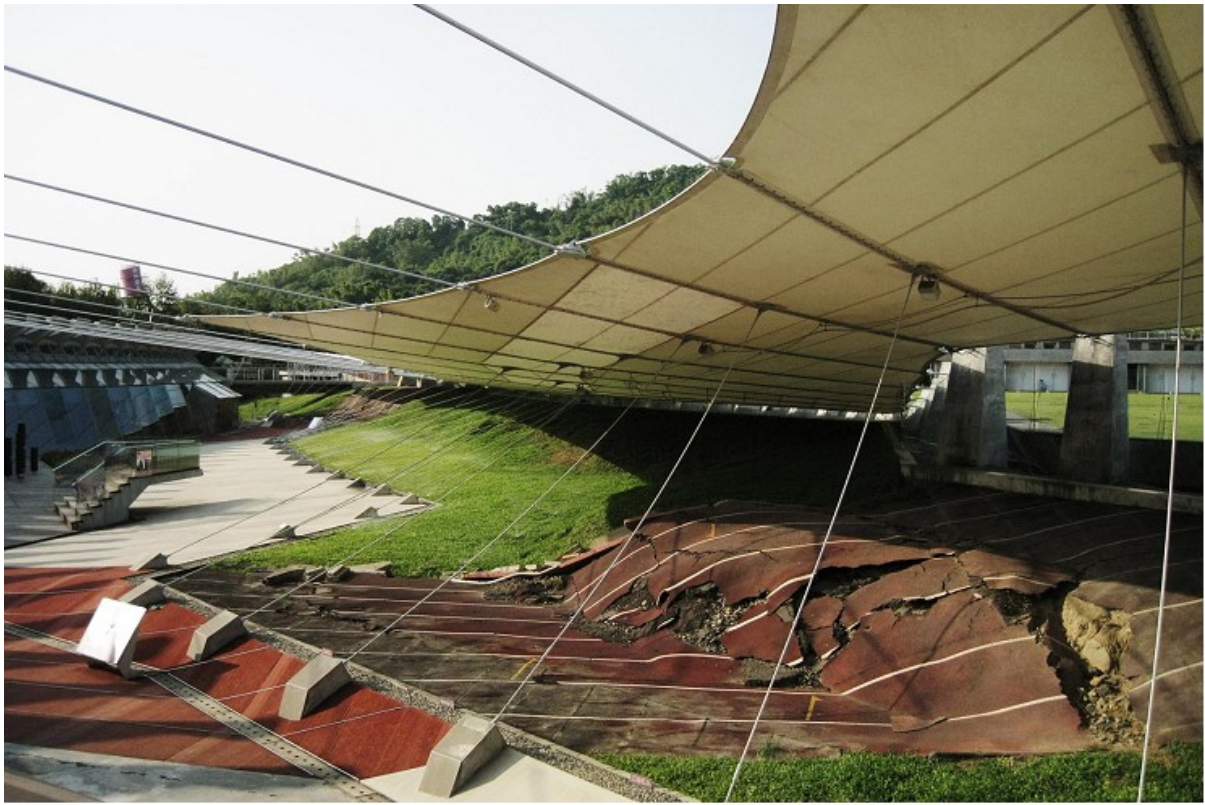
921 地震教育園區目前現址，至今還留下曾被震毀操場，車籠埔斷層切過這裡。