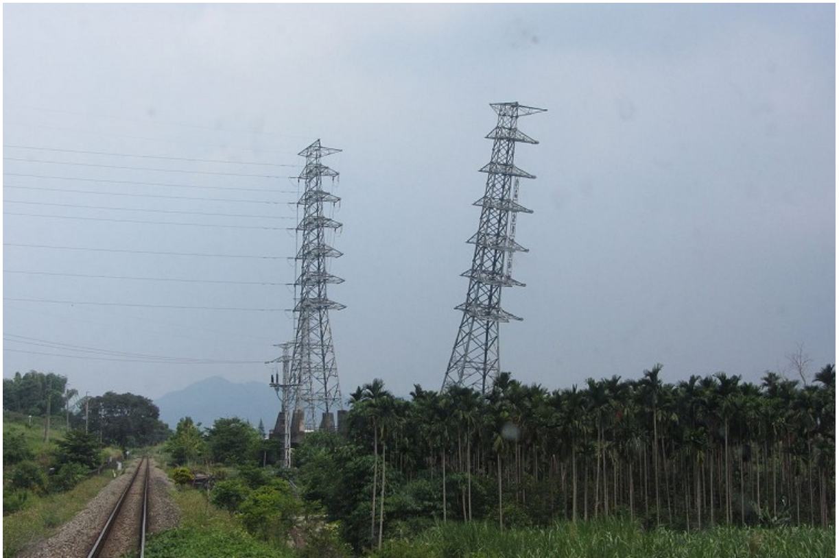
位於南投名間鄉的濁水車站附近高壓電塔，因大地震震歪傾斜。