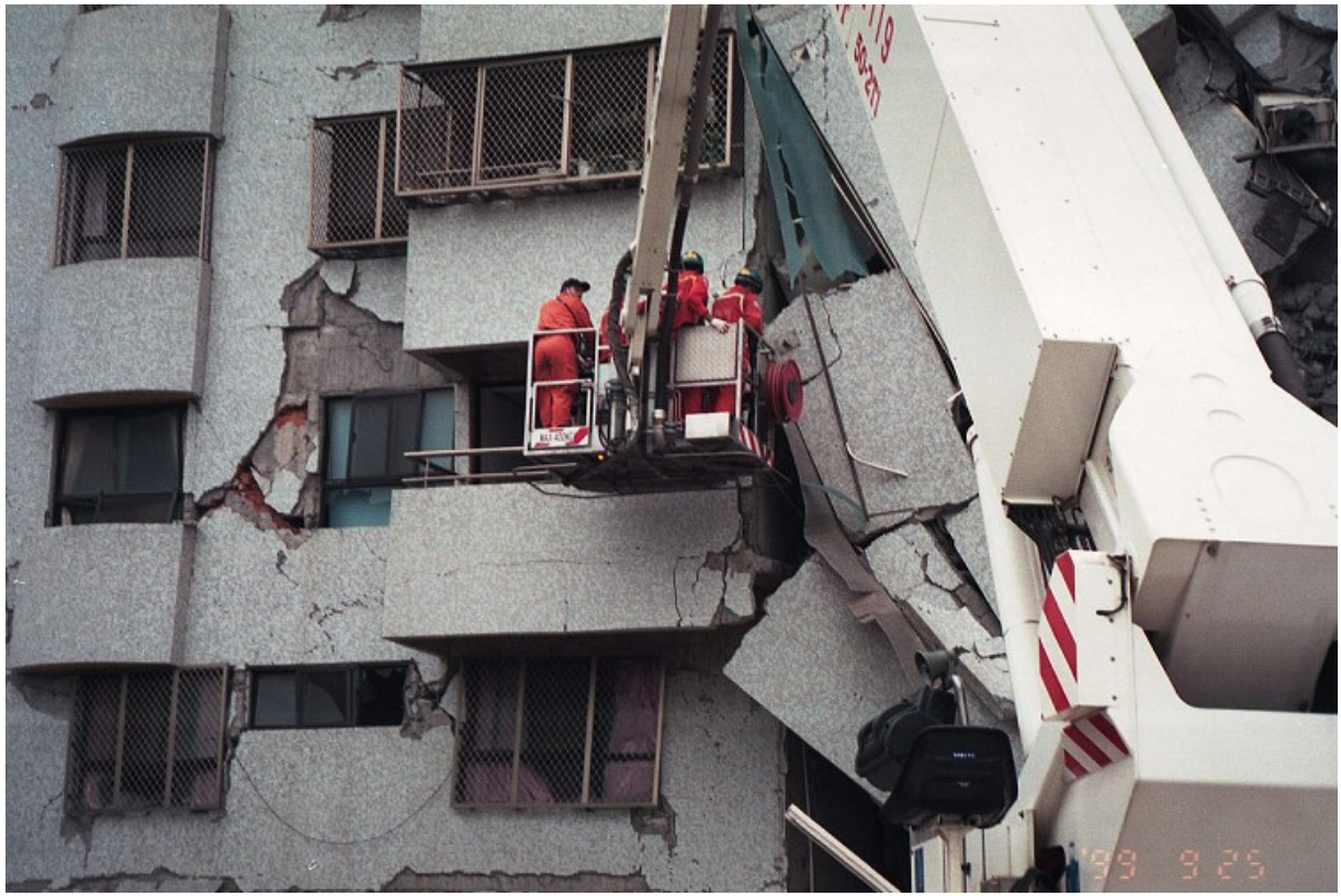
大里「金巴黎」社區大樓倒塌，韓國派員深入救援。（翻攝自維基百科）