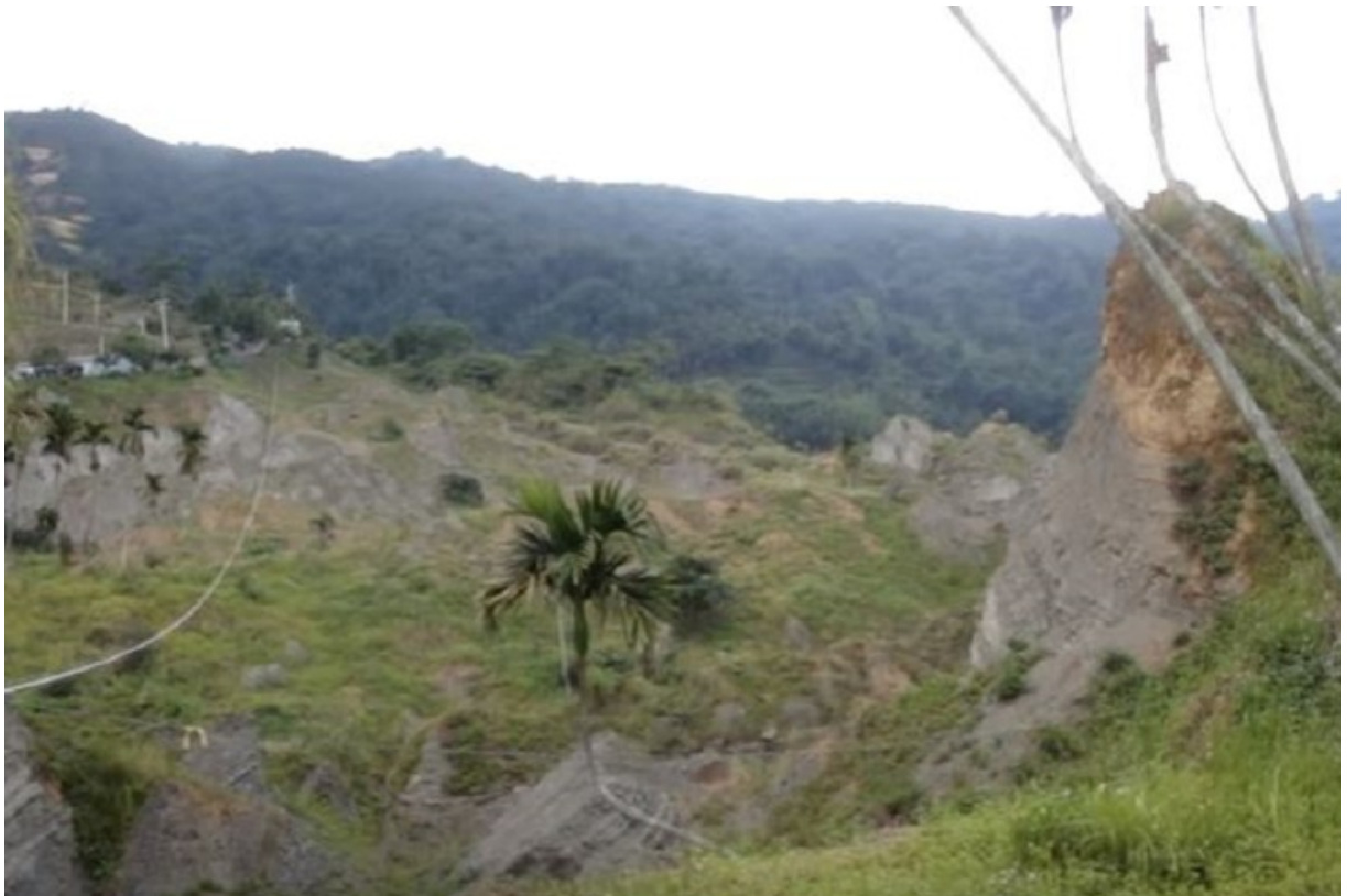
921 大地震時，九份二山北側之崁斗山東南坡面受地震影響，發生大規模順向坡滑動，14 戶共 41 人遭到活埋，其中 22 人迄今仍未尋獲。崩塌大量土石阻斷南港溪支流韭菜胡溪與澀仔坑溪兩條溪谷，形成兩處天然堰塞湖。