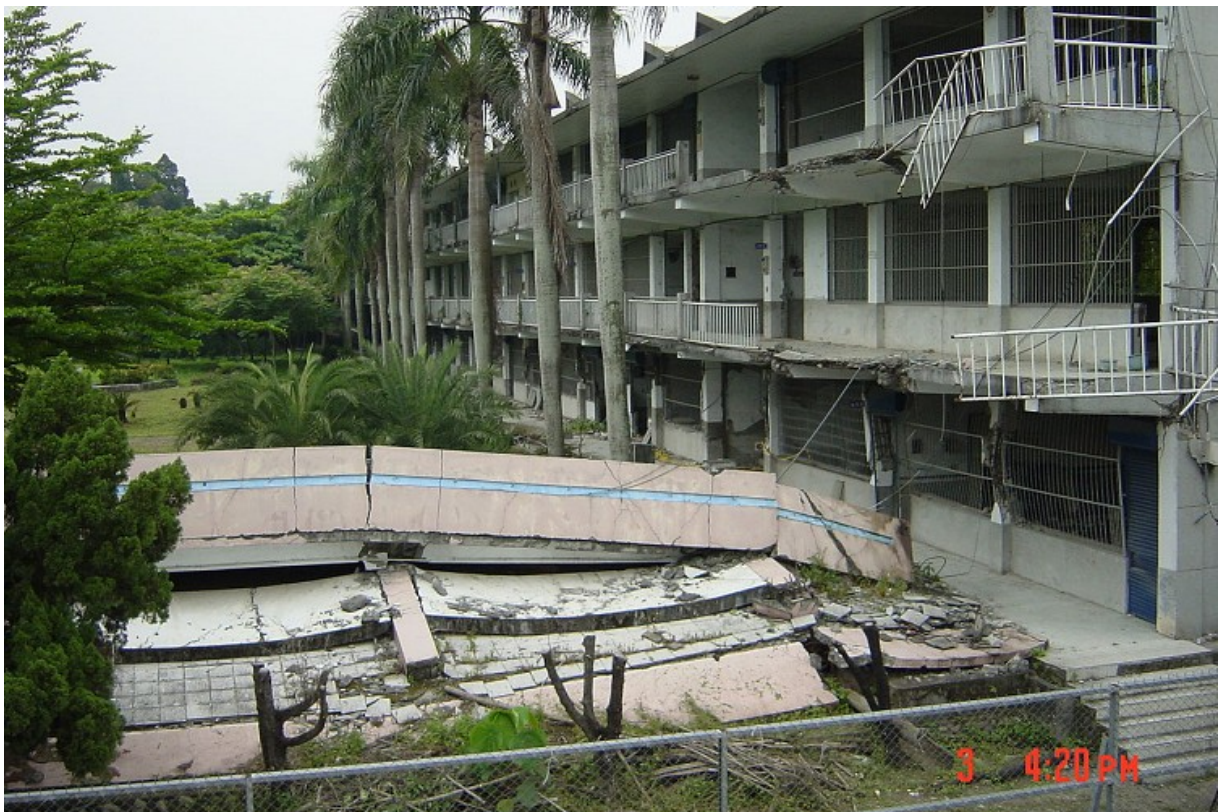
九二一大地震至今 17 周年，也被訂為國家防災日，中央氣象局今天上午 9 時 21 分發出地震測試簡訊，內容指出，新竹縣竹東鎮發生芮氏規模 6.6 地震，地震深度 10 公里，最大震度新竹 7 級、苗栗 6 級、桃園 5 級、台北、宜蘭、台中、南投 4 級。