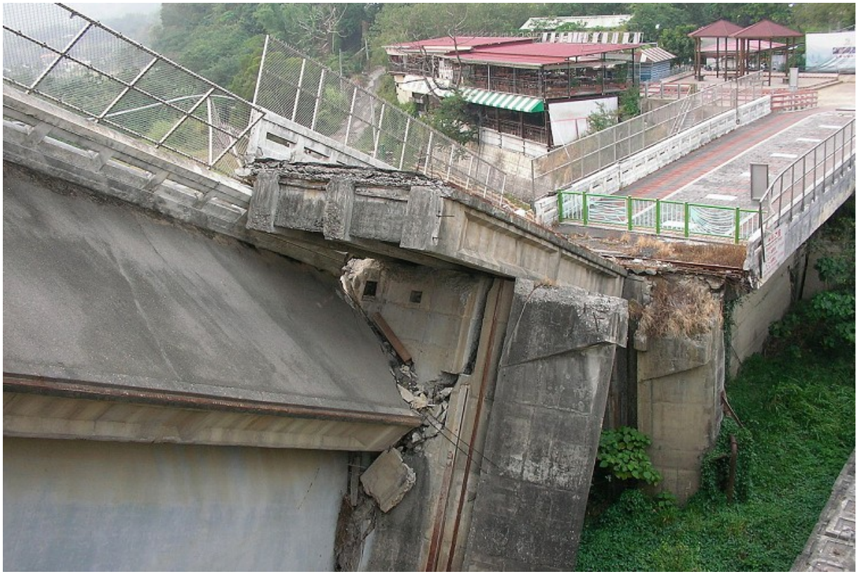
石岡水壩當初受創嚴重，影響整個大台中地區水源正常供應。