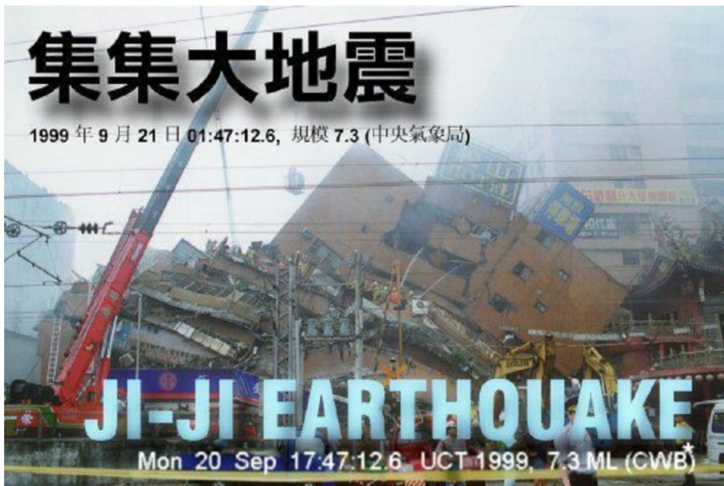
17 年前的集集大地震，仍是台灣人心中永不滅的痛。

如今 18 年了，台灣也在天災預防上獲得許多教訓，讓我們一起回顧那年你我都驚心動魄的九二一。（責任編輯：林芮緹）