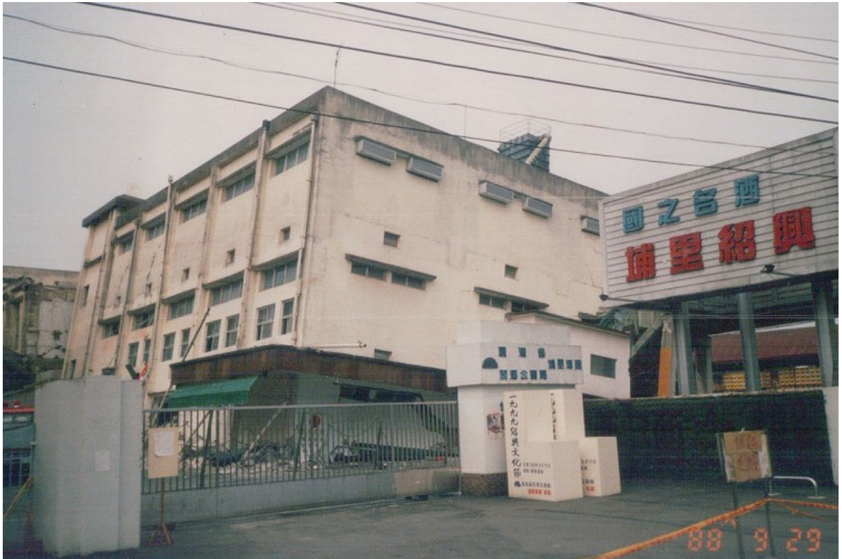
大地震讓埔里酒廠發生瞬間爆炸巨響，驚恐一瞬間，其中部分廠房已經傾斜損失慘重。之後經由行政院九二一災後重建推動委員會的協助指導已恢復風貌。